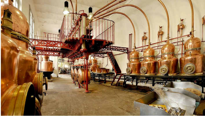
Slika 3. Francuska destilerija Combier koju je izgradio G. Ajfel, XIX vek (Combier, 2021)

sliku destilerije koja ga proizvodi – izgleda ne samo kao ljubav na prvi pogled, već kao avion u poređenju sa svim udruženim destilerijama po šupama Srbije. Ja i puding i paprikaš pravim u istoj šerpi, ali ne vidim baš nikakvu sličnost među njima, pa makar im i boja bila ista.