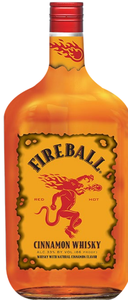
Slika2. Fireball Cinnamon Whisky u PET ambalaži od 1,75 litara(Fireball, 2021).

cene kao da je od zlata. To jeste njihovo pravo, ali broj zasada i činjenica da je ona industrijska voćka i da nema puno alternativne upotreba dunje (retko ko će to da zagriže kao jabuku) držaće cenu na nivou povoljnom za proizvodnju rakije. No, treba da se napravi upotrebom savremenih enoloških sredstava (ne, zaista nisu potrebni šećer i voda) i treba ekspremintisati sa ukusima. Ja sam eksperimentisao sa prepekom meke medovače i šljivovice i dobio nešto jedinstveno. Da sam napravio sa nižim nivoom alkohola, ženska publika bi je koristila još više. Treba tako nešto pokušati i sa dunjom, možda nana, a na kraju zašto ne i taj cimeta ako traže potrošači na tom velikom i nama toliko nedostupnom tržištu.