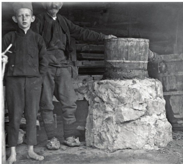
Slika4. Srpska destilerija u Koviljači, XX vek (Vacić, 2016)

Takođe bi i analiza okruženja u marketingu, odnosno sila i faktora koje utiču na tržište rakija zahtevala puno prostora, ali se iz prethodnog teksta mogu se spoznati izvesni trendovi. Za mene bi bilo zanimljivije da se osvrnem malo na istorijat tržišta rakije. Autor Josif Vacić (2016) i Etnografski muzej organizovalisu izložbu „Praviti i piti rakiju“. Izložbeni materijali vrlo realistično opisuju istoriju rakije u Srbiji (vidi slike 4 i 5). Očigledno je da se ne može naći „zlatan“ period za rakiju u Srbiji, u prošlosti se nije desio, a uz pametno poslovanje mogao bi se očekivati u budućnosti, o čemu sam već pisao. Do pojave filoksere u osamdesetim godinama XIX veka u Srbiji se najviše uzgajalo grožđe i pila loza. Izumiranjem vinograda, Srbi su se preorijentisali na šljivu, koja je i danas najzastupljenije voće u Srbiji. Od šljive su pravili i rakiju, ali ona nije ličila na današnju. Pila se kao meka i iz većih čaša nego vino i imala je i niži procenat alkohola od vina. Da se pilo destilovano piće nižeg procenta alkohola bilo je uobičajeno svuda u okruženju kao zaštita od kolere zbog zagađene vode. Šljiva se dakle nije koristila većinom za rakiju, već su postojali isplativiji načini zarade od nje. Početkom veka ona se izvozila kao džem u buradima, ti izvozni poslovi su se tada zaključivali na nivou vlada. Crta u karakteru da se neko bezobrazno