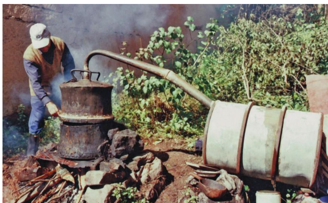
Slika 5. Srpska destilerija u Pirotu, XXI vek (Vacić, 2016)

pametnije i isplativije stvari. Mnogi nemaju interesa da se dave u dimu i mirisu džibre kada kvalitetniju rakiju mogu da kupe u radnji (ja prvi) i prodaju svoje destilerije sa zadovoljstvom. Sredstva koja su danas zarobljena u svim tim kazanima su čist gubitak za ekonomiju i blagostanje onih koji ih imaju, jer niti garantuju niti ostvaruju prihod. Naravno, zanemarljiv deo rakijaša koji koriste pečenje rakije za druženje s društvom, beg od žene ili hobi uz mali voćnjak nastaviće da pravi rakiju, ali njihova proizvodnja imaće minoran uticaj na sveukupno dešavanje na tržištu, koje je nekoliko puta veće nego u našem vremenu tržišta nerazvijenoga.